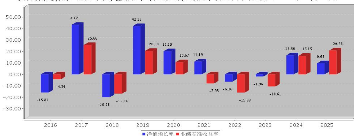
安信新常态股票A基金每年净值增长率与同期业绩比较基准收益率的对比图（2025年12月31日）

注：基金合同生效当年期间的相关数据按实际存续期计算，基金的过往业绩并不代表其未来表现。