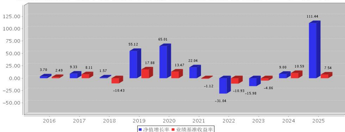
安信新回报混合C基金每年净值增长率与同期业绩比较基准收益率的对比图（2025年12月31日）

注：基金合同生效当年期间的相关数据按实际存续期计算。基金的过往业绩并不代表其未来表现。