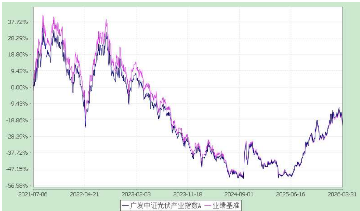
广发中证光伏产业指数 C