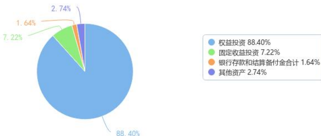
投资组合资产配置图表（数据截至日期：2026年03月31日）