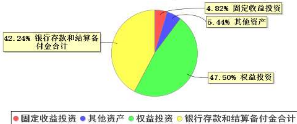
投资组合资产配置图表 (2026年3月31日)