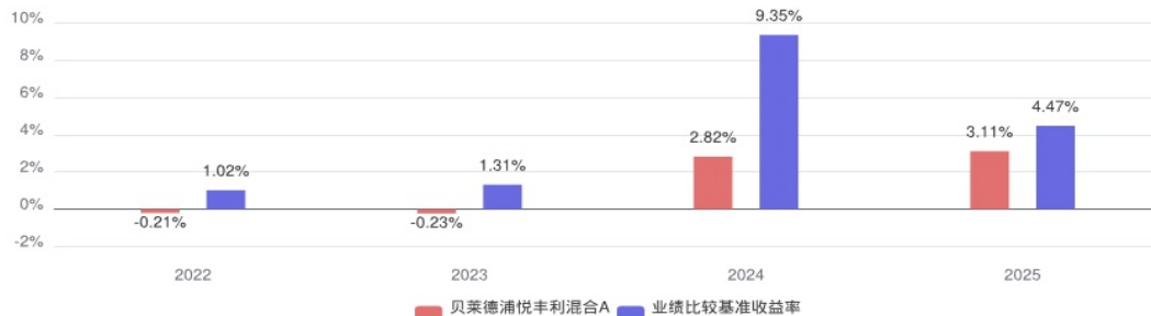
贝莱德浦悦丰利混合A自基金合同生效以来每年的净值增长率及与同期业绩比较基准的比较图

注：1、本基金合同于2022年11月23日生效，合同生效当年按实际存续期计算。2、数据截止日期为2025年12月31日。3、基金的过往业绩不代表未来表现。