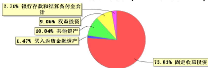
投资组合资产配置图表(2026年3月31日)

● 固定收益投资 ● 买入返售金融资产 ● 其他资产 ● 权益投资 ● 银行存款和结算备付金合计