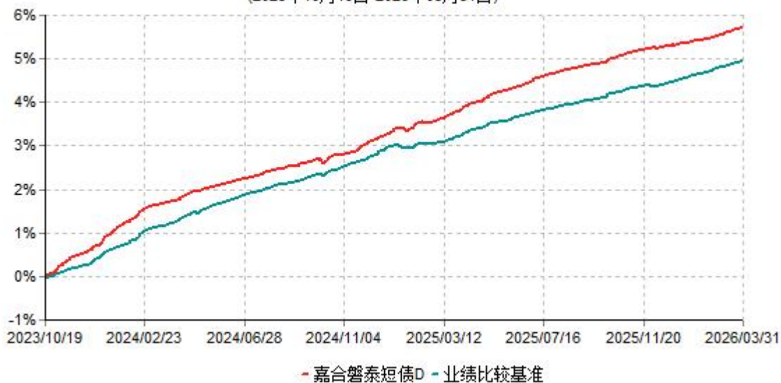
嘉合磐泰短债D累计净值增长率与业绩比较基准收益率历史走势对比图 (2023年10月19日-2026年03月31日)

注：本基金于 2023 年 10 月 19 日增设 D 类基金份额，D 类基金份额实际存续从 2023 年 10 月 19 日开始。