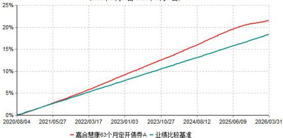
嘉合慧康63个月定开债券A累计净值增长率与业绩比较基准收益率历史走势对比图 (2020年08月04日-2026年03月31日)