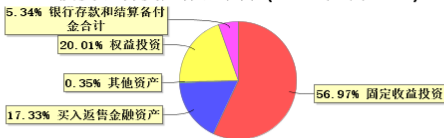
投资组合资产配置图表(2026年3月31日)

● 固定收益投资 ● 买入返售金融资产 ● 其他资产 ● 权益投资 ● 银行存款和结算备付金合计