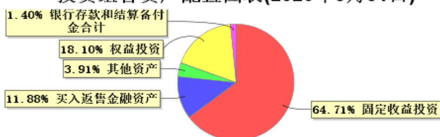
投资组合资产配置图表(2026年3月31日)

● 固定收益投资 ● 买入返售金融资产 ● 其他资产 ● 权益投资 ● 银行存款和结算备付金合计