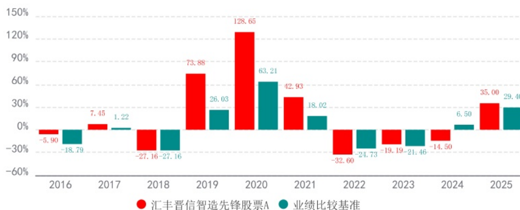
基金的过往业绩不代表未来表现，数据截止日：2025年12月31日