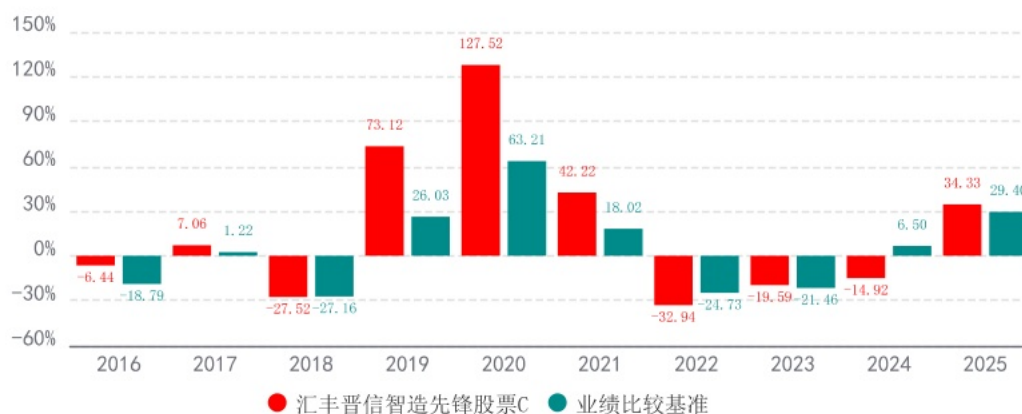
基金的过往业绩不代表未来表现，数据截止日：2025年12月31日