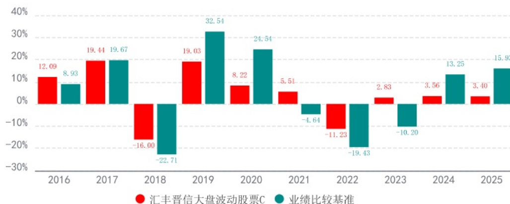
基金的过往业绩不代表未来表现，数据截止日：2025年12月31日

注：本基金的基金合同于2016年3月11日生效，本基金基金合同生效当年按实际存续期计算，不按整个自然年度进行折算。