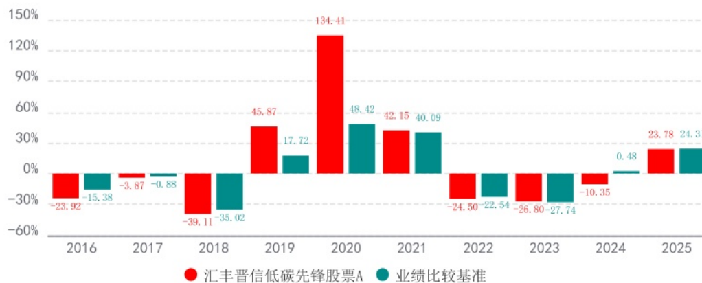
基金的过往业绩不代表未来表现，数据截止日：2025年12月31日