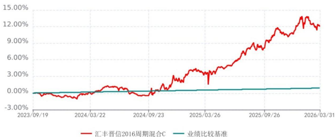
汇丰晋信2016周期混合C累计净值增长率与业绩比较基准收益率历史走势对比图 (2023年09月19日-2026年03月31日)

注：1. 按照基金合同的约定，本报告期内，本基金的资产配置比例为：股票类资产比例 0-5%，固定收益类资产比例 95-100%。