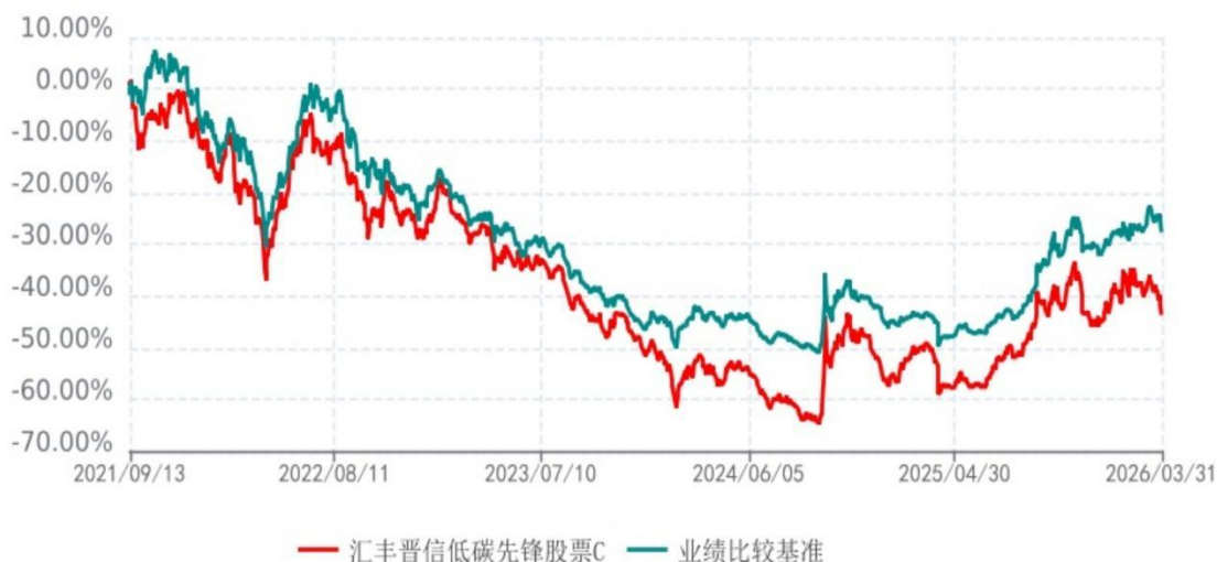
汇丰晋信低碳先锋股票C累计净值增长率与业绩比较基准收益率历史走势对比图 (2021年09月13日-2026年03月31日)