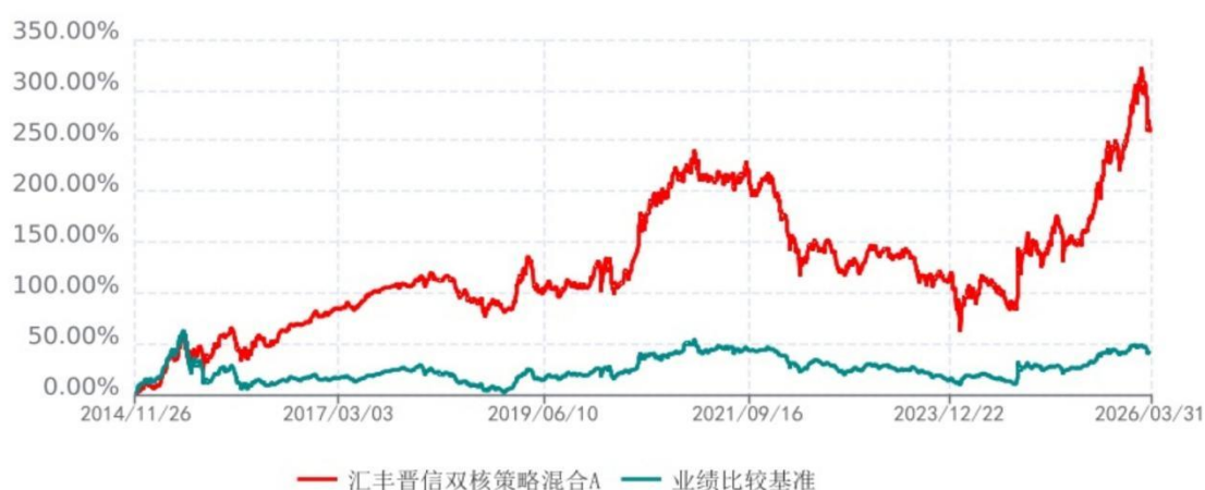
汇丰晋信双核策略混合A累计净值增长率与业绩比较基准收益率历史走势对比图 (2014年11月26日-2026年03月31日)