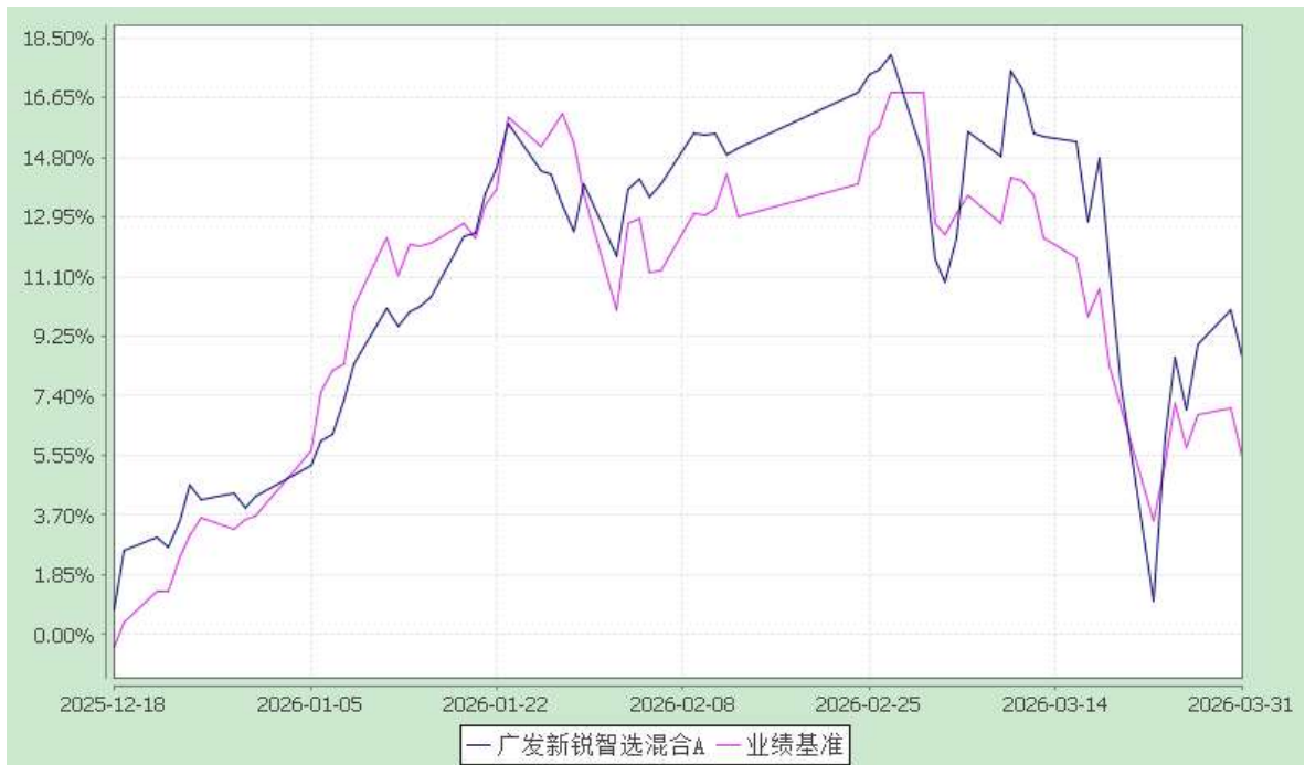
广发新锐智选混合 E