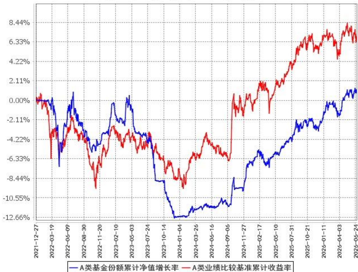
A类基金份额累计净值增长率与同期业绩比较基准收益率的历史走势对比图 (2021年12月27日至2026年6月30日)