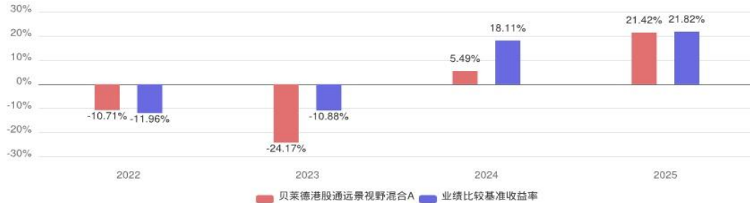
贝莱德港股通远景视野混合A自基金合同生效以来每年的净值增长率及与同期业绩比较基准的比较图

注：1、本基金合同于2022年1月21日生效，合同生效当年按实际存续期计算。2、数据截止日期为2025年12月31日。3、基金的过往业绩不代表未来表现。