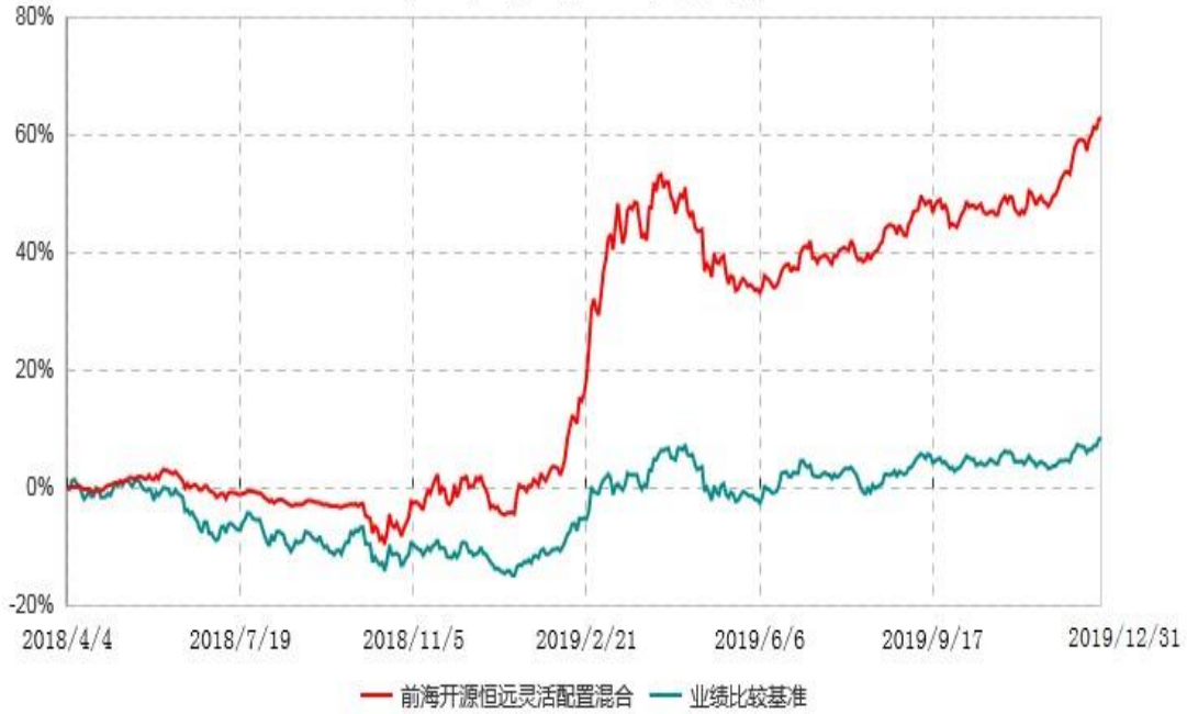
前海开源恒远灵活配置混合型证券投资基金累计净值增长率与业绩比较基准收益率历史走势对比图 (2018年04月04日-2019年12月31日)