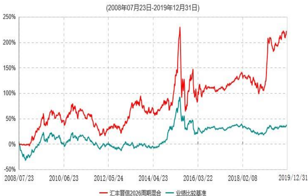
汇丰晋信2026生命周期证券投资基金累计净值增长率与业绩比较基准收益率历史走势对比图