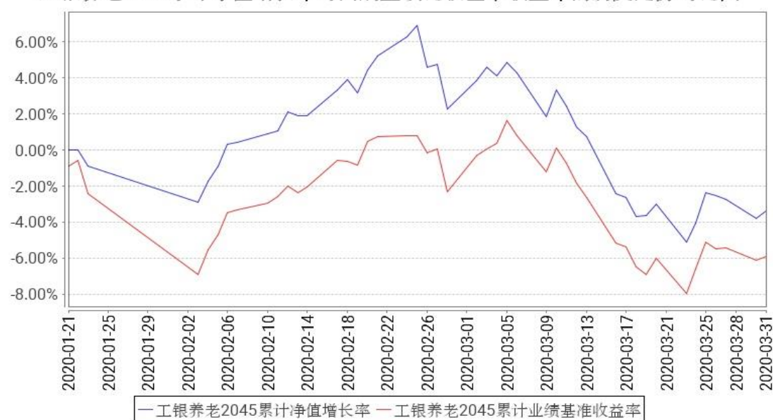
工银养老2045累计净值增长率与同期业绩比较基准收益率的历史走势对比图

注：1、本基金基金合同于2020年1月21日生效。截至报告期末，本基金尚处于建仓期。