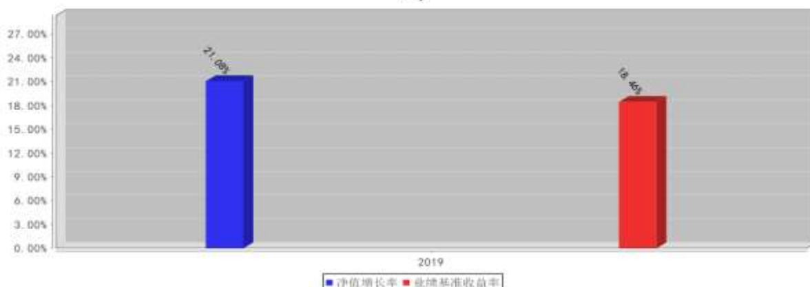
兴全安泰平衡养老三年持有(FOF)基金每年净值增长率与同期业绩比较基准收益率的对比图(2019年12月31日)