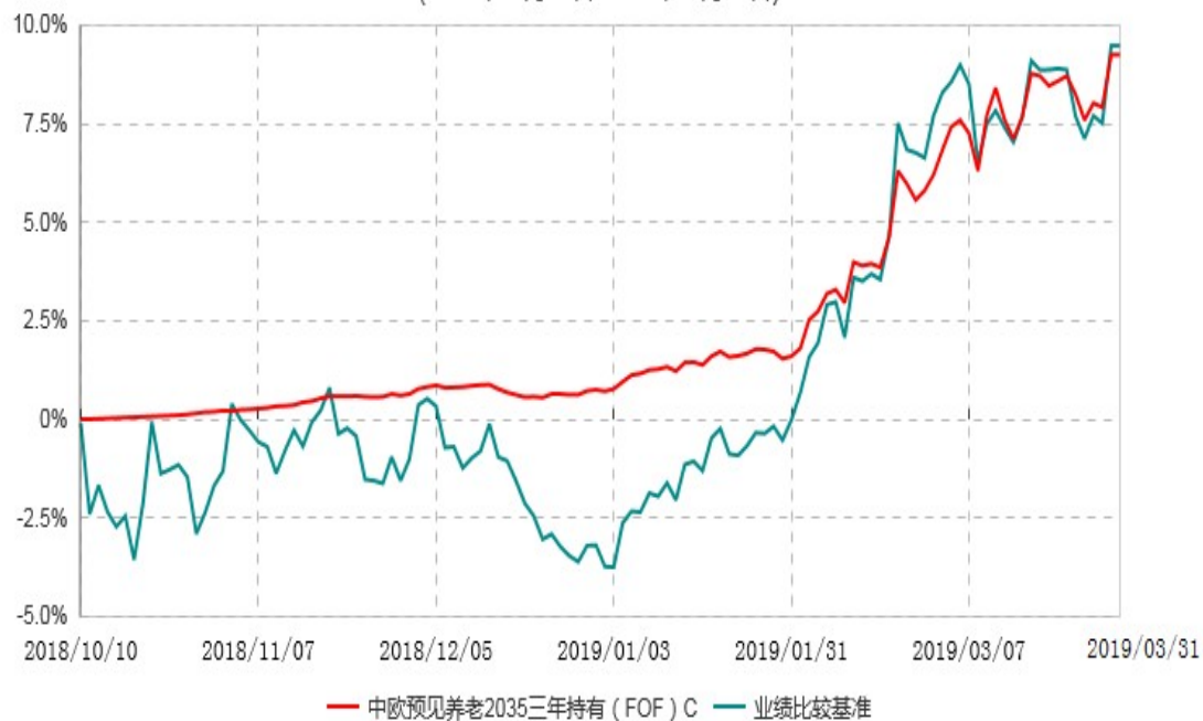
中欧预见养老2035三年持有（FOF）C累计净值增长率与业绩比较基准收益率历史走势对比图 (2018年10月10日-2019年03月31日)

注：本基金基金合同生效日期为 2018 年 10 月 10 日，自基金合同生效日起到本报告期末不满一年，按基金合同的规定，本基金自基金合同生效起六个月为建仓期，建仓期结束时各项资产配置比例应当符合基金合同约定。