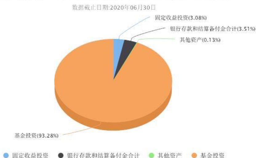
汇添富养老2040五年持有混合(FOF)投资组合资产配置图表