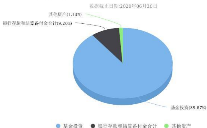
汇添富养老2050五年持有混合(FOF)投资组合资产配置图表