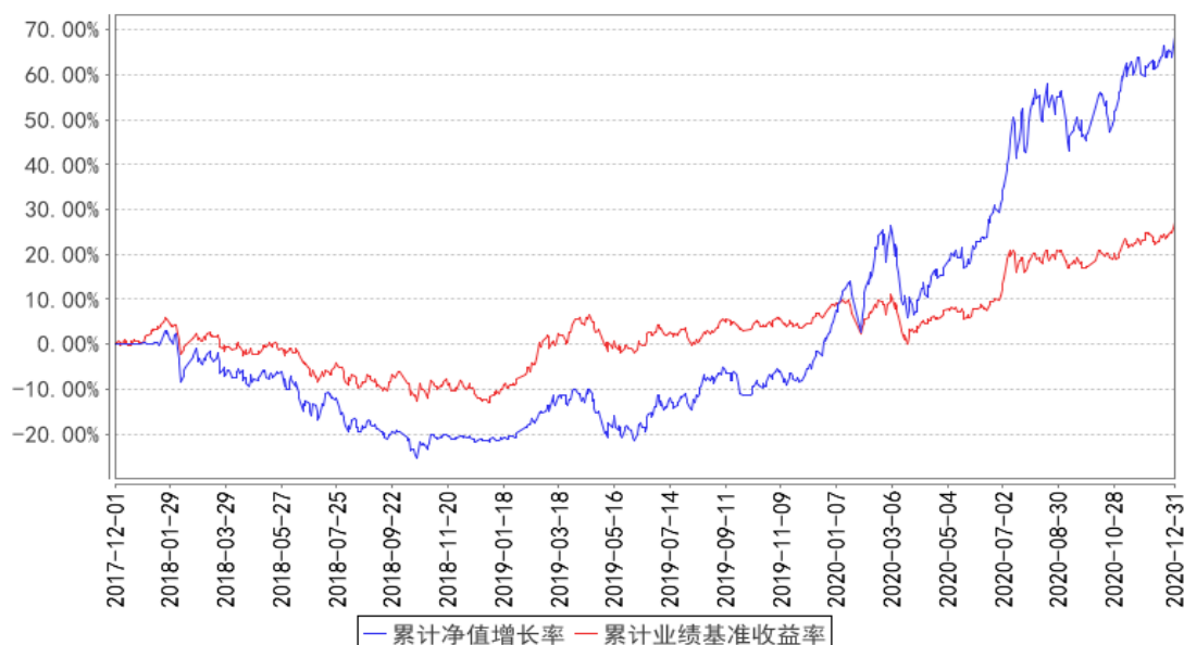
太平改革红利精选累计净值增长率与同期业绩比较基准收益率的历史走势对比图