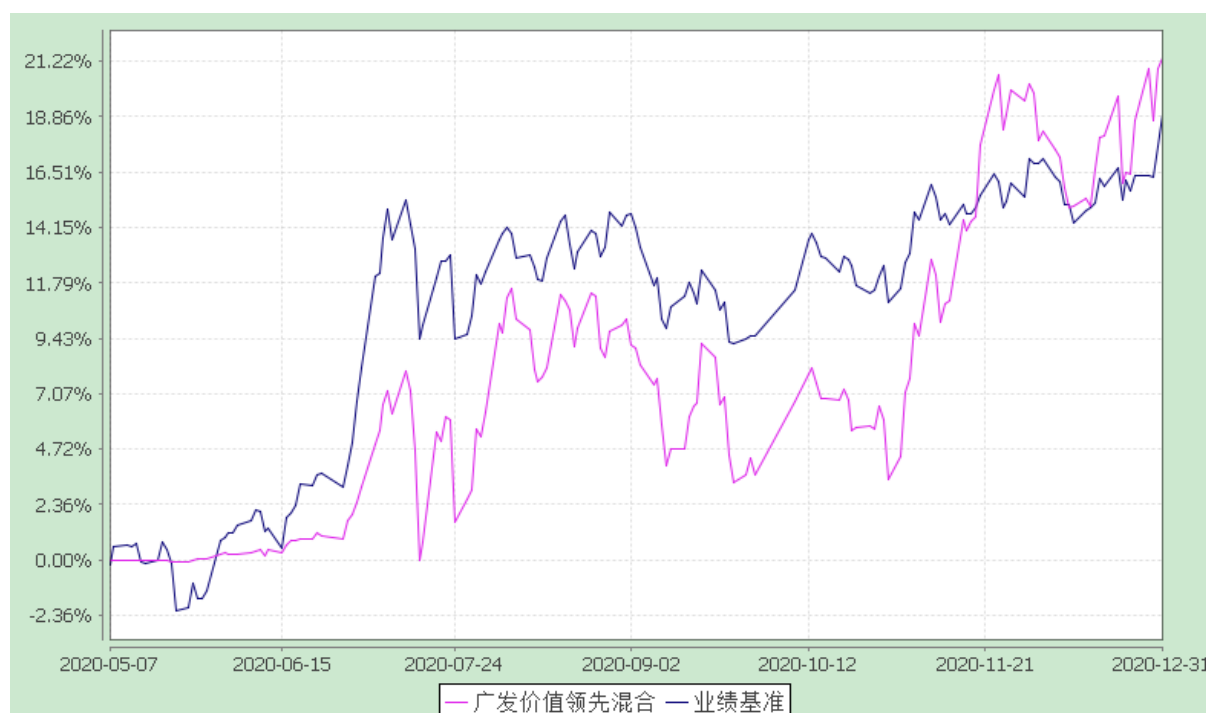
广发价值领先混合型证券投资基金 份额累计净值增长率与业绩比较基准收益率的历史走势对比图 (2020年5月7日至2020年12月31日)