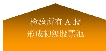
图：本基金选股流程