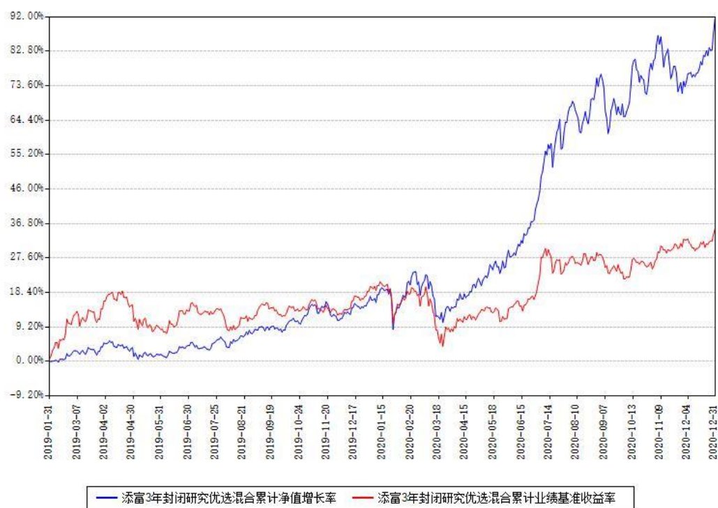
添富3年封闭研究优选混合累计净值增长率与同期业绩基准收益率对比图

注：本基金建仓期为本《基金合同》生效之日（2019 年 01 月 31 日）起 6 个月，建仓期结束时各项资产配置比例符合合同约定。