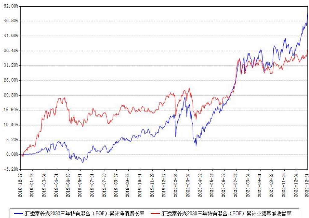
汇添富养老2030三年持有混合 (FOF) 累计净值增长率与同期业绩比较基准收益率对比图

注：本基金建仓期为本《基金合同》生效之日（2018年12月27日）起6个月，建仓期结束时各项资产配置比例符合合同约定。