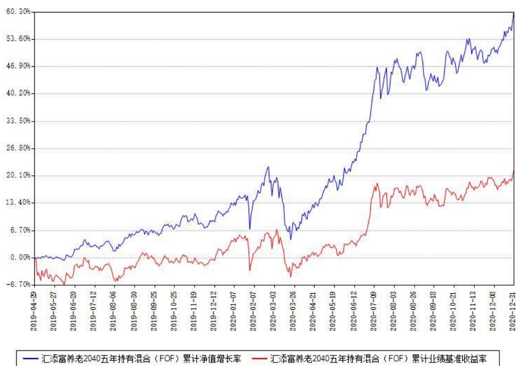
汇添富养老2040五年持有混合 (FOF) 累计净值增长率与同期业绩基准收益率对比图

注：本基金建仓期为本《基金合同》生效之日（2019年04月29日）起6个月，建仓期结束时各项资产配置比例符合合同约定。