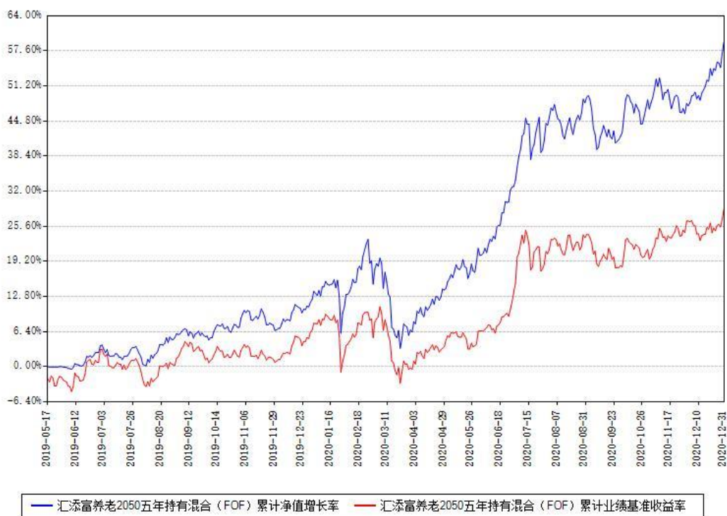
汇添富养老2050五年持有混合 (FOF) 累计净值增长率与同期业绩基准收益率对比图

注：本基金建仓期为本《基金合同》生效之日（2019年05月17日）起6个月，建仓期结束时各项资产配置比例符合合同约定。