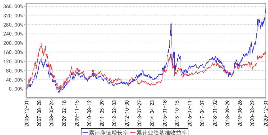
泰达宏利首选企业股票累计净值增长率与同期业绩比较基准收益率的历史走势对比图

注：本基金在建仓期结束时及截止报告期末各项投资比例已达到基金合同规定的比例要求。