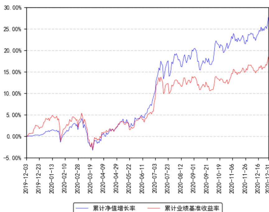
南方养老目标日期2030 (F0F) 累计净值增长率与同期业绩比较基准收益率的历史走势对比图