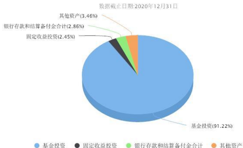
汇添富养老2040五年持有混合(FOF)投资组合资产配置图表