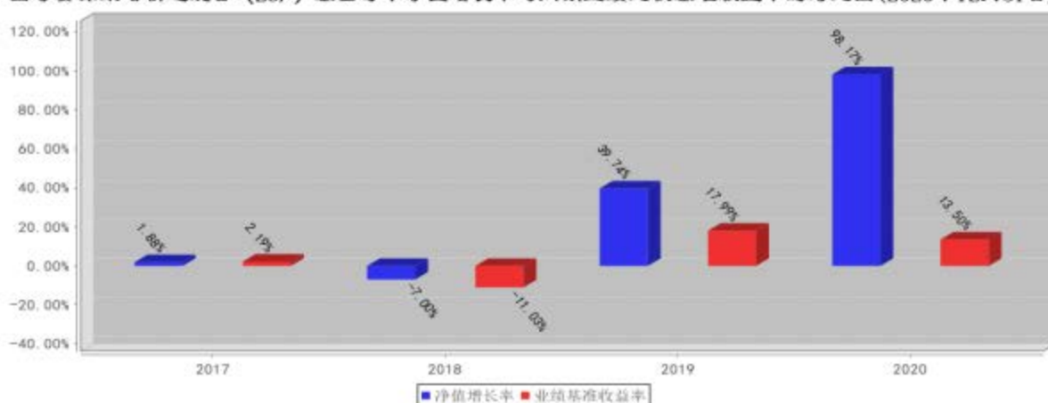
国寿安保策略精选混合 (LOF) 基金每年净值增长率与同期业绩比较基准收益率的对比图 (2020年12月31日)

注:业绩表现截止日期 2020 年 12 月 31 日。基金过往业绩不代表未来表现。