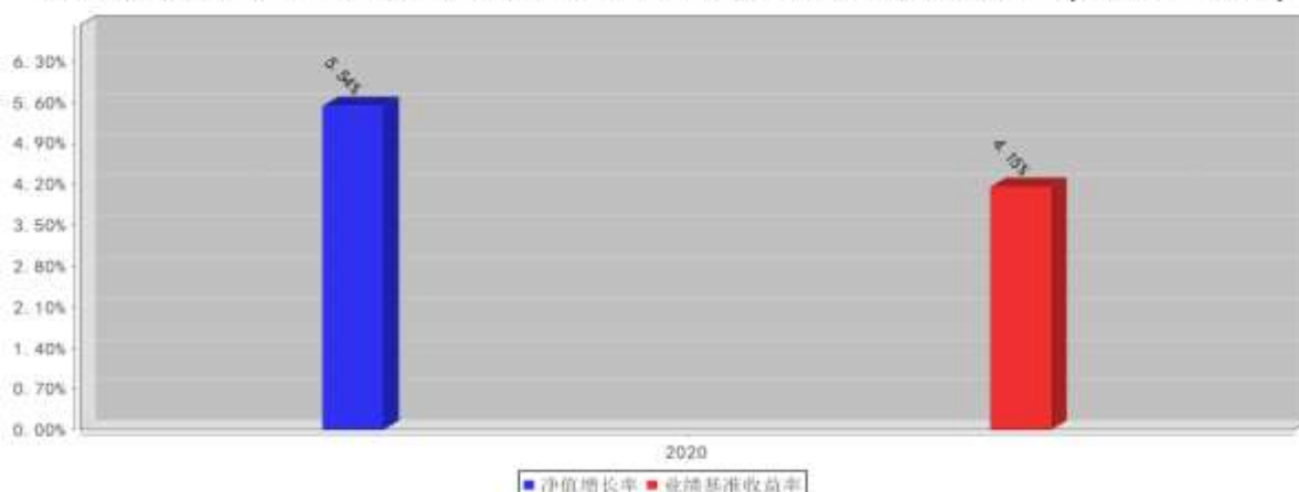
泰达宏利泰和稳健养老一年FOF基金每年净值增长率与同期业绩比较基准收益率的对比图(2020年12月31日)

注:本基金成立于2020年6月2日,2020年度净值增长率的计算期间为2020年6月2日至2020年12月31日。基金的过往业绩不代表未来表现。