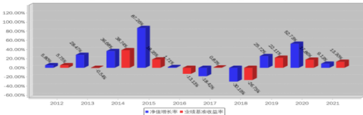
大摩多因子策略混合基金每年净值增长率与同期业绩比较基准收益率的对比图(2021年12月31日)