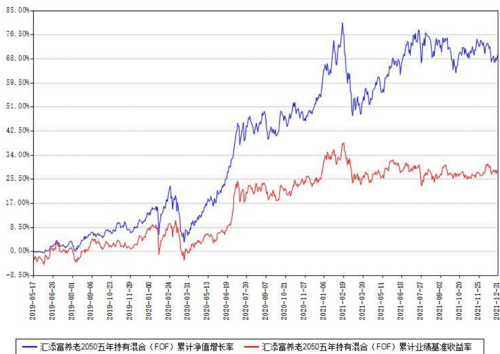
汇添富养老2050五年持有混合 (FOF) 累计净值增长率与同期业绩基准收益率对比图

注：本基金建仓期为本《基金合同》生效之日（2019年05月17日）起6个月，建仓期结束时各项资产配置比例符合合同约定。