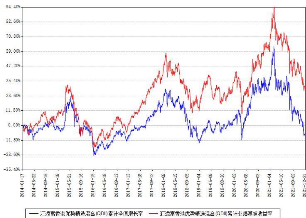
汇添富香港优势精选混合(QDII)累计净值增长率与同期业绩基准收益率对比图

注：1、本基金由原汇添富亚洲澳洲成熟市场（除日本外）优势精选股票型证券投资基金于2014年01月17日转型而来。