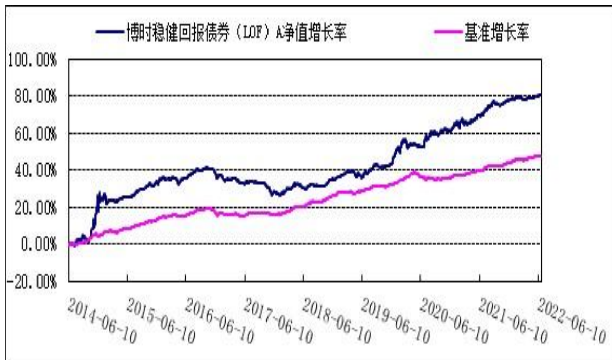
博时稳健回报债券（LOF）C