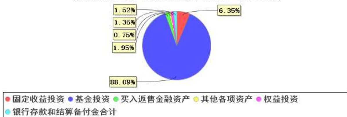
投资组合资产配置图表(2022年6月30日)