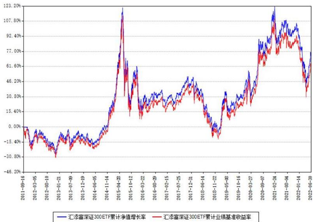
汇添富深证300ETF累计净值增长率与同期业绩基准收益率对比图