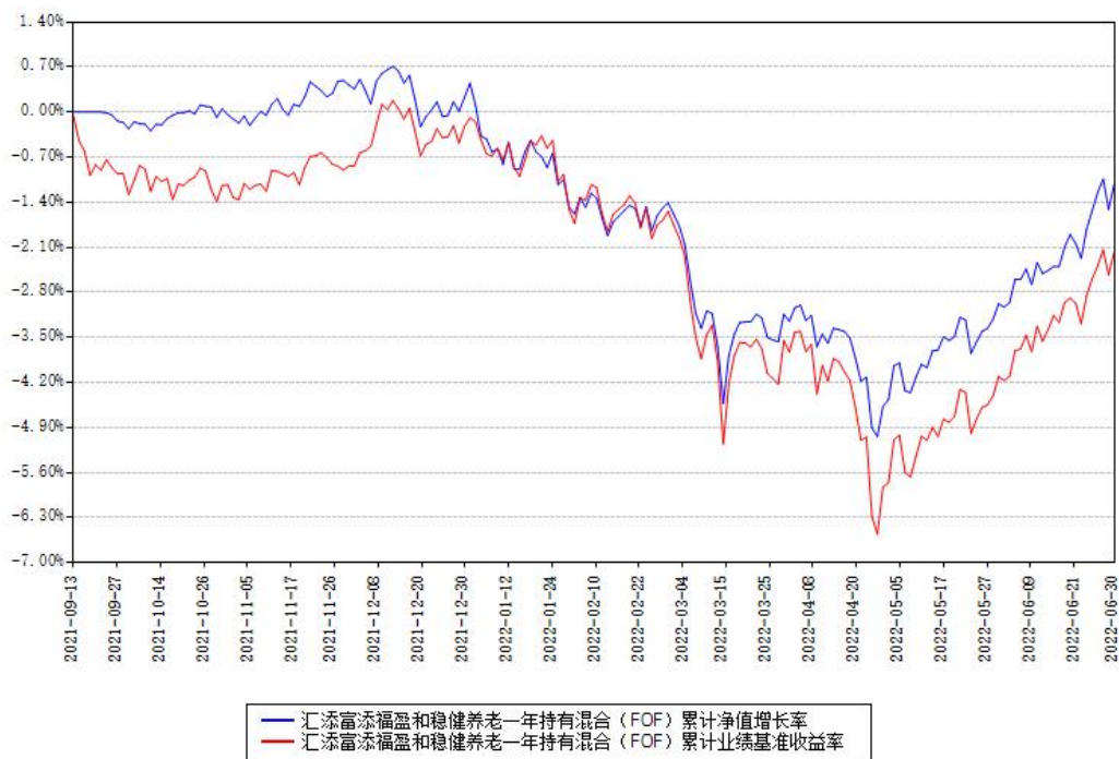
汇添富添福盈和稳健养老一年持有混合（FOF）累计净值增长率与同期业绩基准收益率对比图