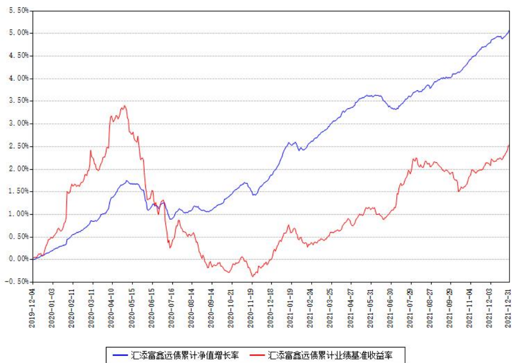
汇添富鑫远债累计净值增长率与同期业绩基准收益率对比图