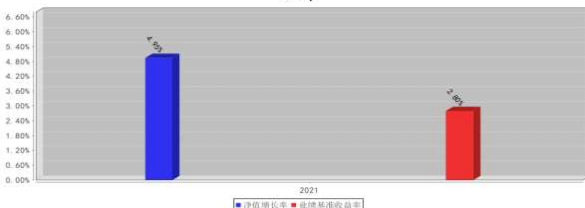
兴全安泰稳健养老一年持有混合FOFA基金每年净值增长率与同期业绩比较基准收益率的对比图(2021年12月31日)