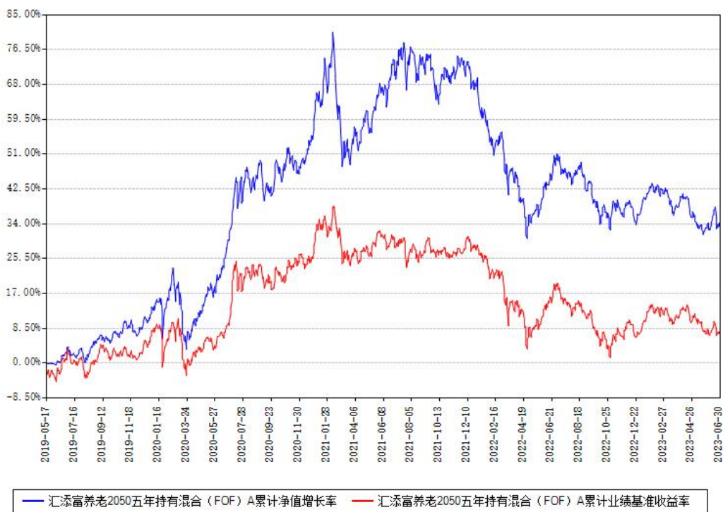
汇添富养老2050五年持有混合 (FOF) A累计净值增长率与同期业绩比较基准收益率对比图